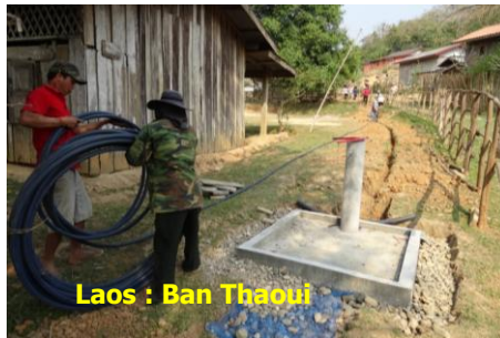
Laos : Ban Thaoui

Partenaires : L'ONG d'aide médicale Lane Xang, CCAS, Communauté de commune de Vinay, SACO, Agence de l'eau Rhône Méditerranée Corse, la Compagnie Nationale du Rhône (CNR), SDE 07.