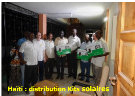
Haïti : distribution Kits solaires

Vietnam Dalat : La mission qui s'est réalisée en février-mars 2016 a permis de former 26 jeunes déscolarisés et en recherche d'emploi au métier d'électricien en installations intérieures. Cette formation permet d'acquérir une culture à la sécurité électrique en milieu rural et urbain ainsi qu'une aide à l'économie d'énergie.