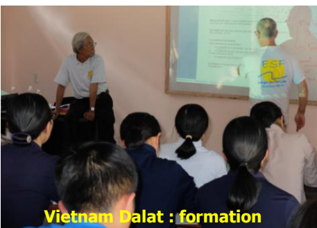
Vietnam Dalat : formation

Partenaires : CCAS, Fondation eDF, le centre de formation La San Da Lat.