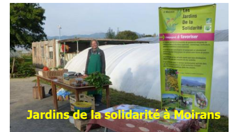
Jardins de la solidarité à Moirans

La mission s'est réalisée en juin 2016, elle a consisté à la rénovation d'un réseau électrique enterré qui n'était plus adapté à la croissance et à la sécurité des installations (bureaux, salle de réunion, serres,...) ni aux futurs développements (irrigation,...).