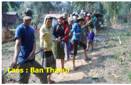
Laos : Ban Thaoui