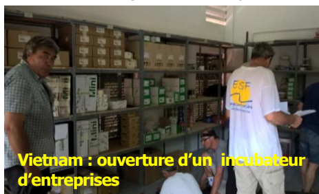
Vietnam : ouverture d'un incubateur d'entreprises

Partenaires : La Fondation Schneider Electric, la filiale Schneider Electric Vietnam et la région Rhône-Alpes.