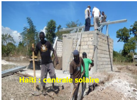
Haïti : centrale solaire

La seconde phase de la mission était réservée à la distribution de kits solaires indya à des associations sélectionnées en 2013. Partenaires : Savoie Solidaire, Syane, CCAS, Schneider -Electric, Voltabri, Soley Lakay, Certisolis.